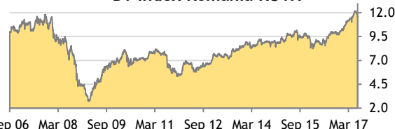
BT Index Romania ROTX